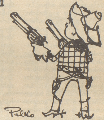
Kino-logisches «Hands up!»

was sie mit mir anstellen können, haben die Filmproduzenten in Hollywood mir schon angetan.»