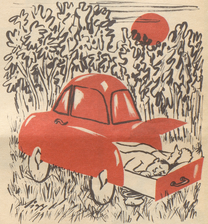
Liegesitze nun auch für den Kleinstwagen