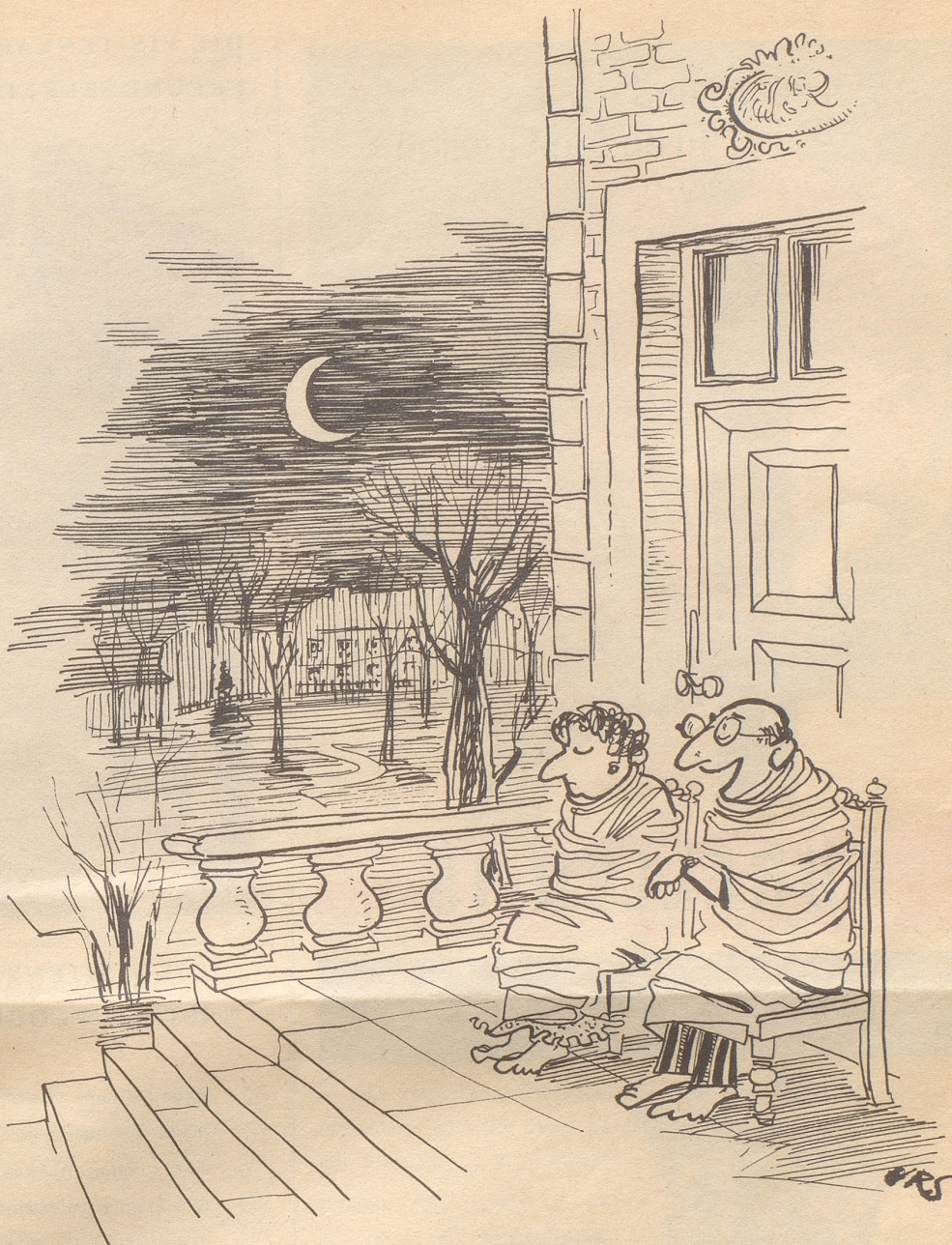
Training fürs Camping

«Eure Gesangproben dauern immer länger», schimpfte die Frau, als der Mann zu später Stunde heimkehrte. «Was macht ihr nur so lang?» «Wir jassen, wir kegeln, trinken und rauchen.» «Ja, wann singt ihr denn?» «Wenn wir nach Hause gehn.» Dick