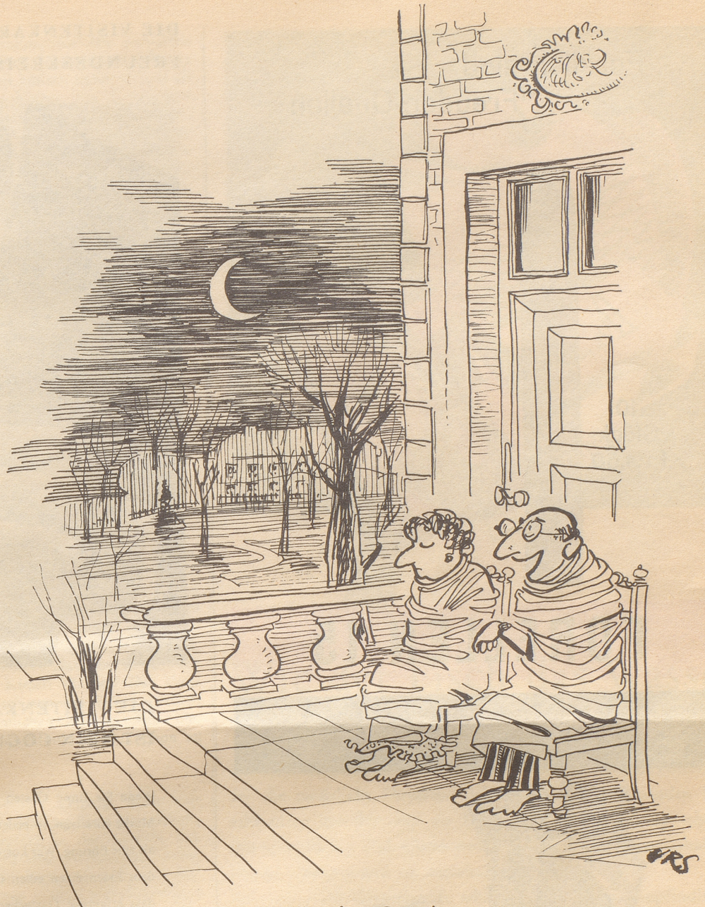
Training fürs Camping

«Eure Gesangproben dauern immer länger», schimpfte die Frau, als der Mann zu später Stunde heimkehrte. «Was macht ihr nur so lang?» «Wir jassen, wir kegeln, trinken und rauchen.» «Ja, wann singt ihr denn?» «Wenn wir nach Hause gehn.» Dick