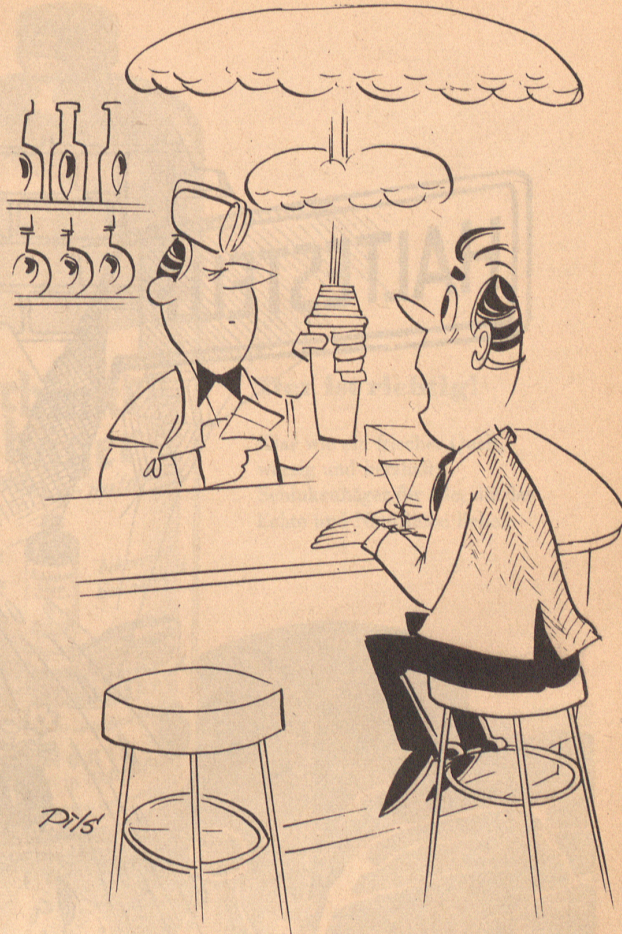
«Es ist unser zeitgemäßestes Getränk.»