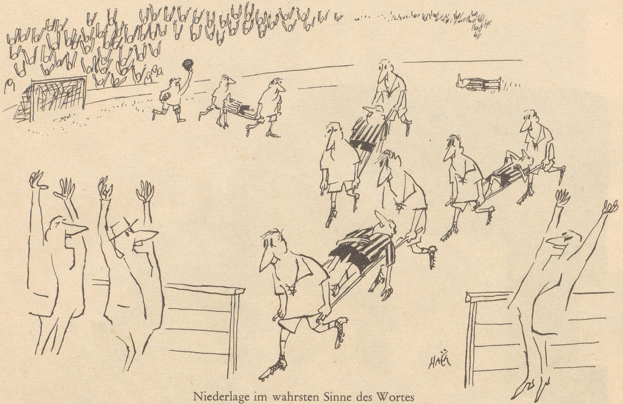
Niederlage im wahrsten Sinne des Wortes