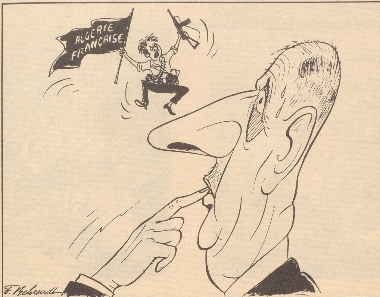
Auf der Nase herum...