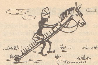
Das Steckenpferd des Fakirs

Chef: «Zum Teufel, Mädchen, ich hab keine Zeit, hinter welchem Ohr?» Lb.