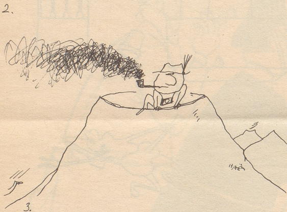
Erinnerung an Italien