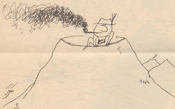
Erinnerung an Italien