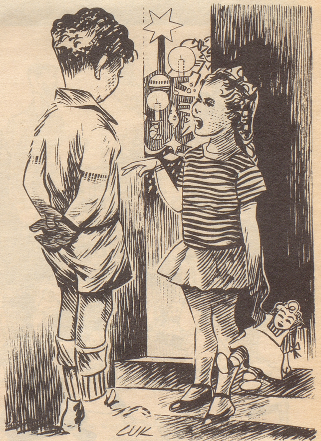
«Vater und Mutter haben vergessen wo sie unsere Geschenke versteckten. Sollen wir es ihnen sagen?»