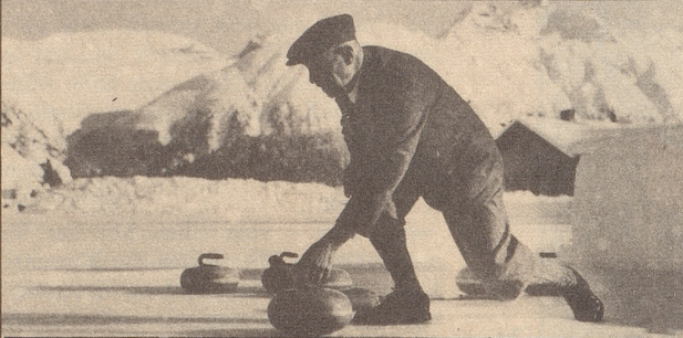
Generalvertreter für die Schweiz: E. Oehninger AG, Montreux

Wer zu leben weiss, versteht auch zu wählen: BOLS Liköre und Gins, Apricot, Genever, Silver Top Dry Gin, Cognac BISQUIT, Champagne POMMERY, Scotch Whisky BALANTINE, Bourbon Whisky OLD FORESTER.