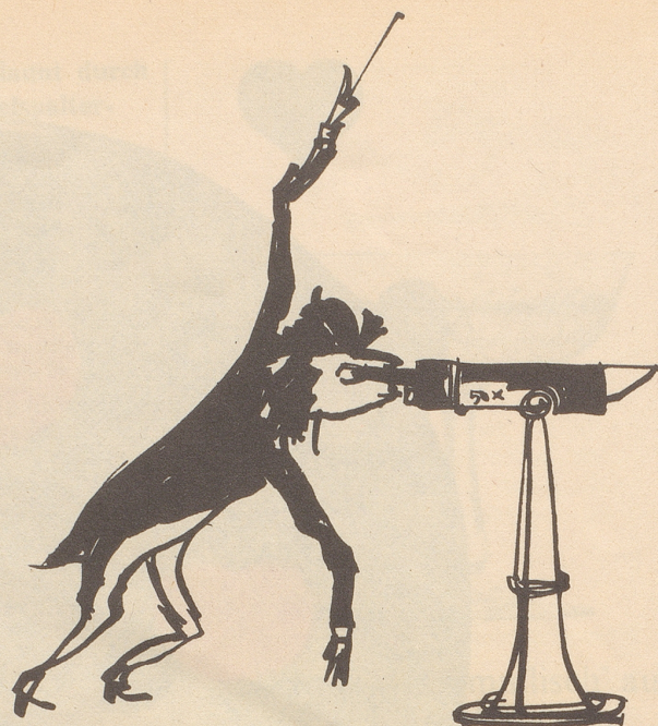
Der Dirigent des großen Orchesters