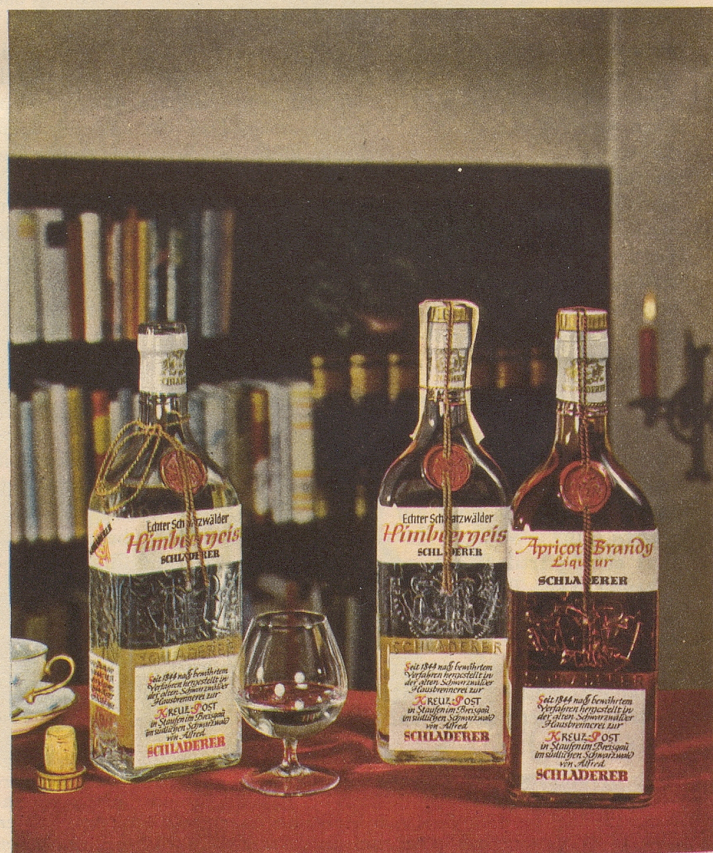
SCHLADERERS echter Schwarzwälder Himbeergeist und Apricot

Schon der Duft verheisst höchsten Genuss – das vollkommene Aroma übertrifft Ihre Erwartungen!