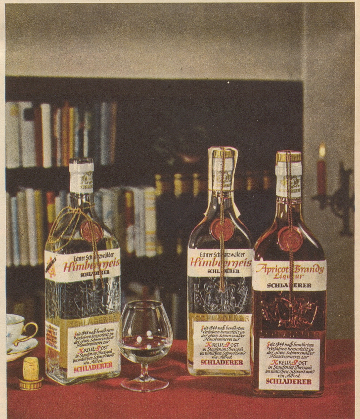
SCHLADERERS echter Schwarzwälder Himbeergeist und Apricot

Schon der Duft verbeisst höchsten Genuss – das vollkommene Aroma übertrifft Ihre Erwartungen!