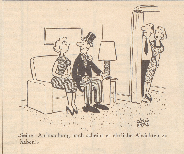
«Seiner Aufmachung nach scheint er ehrliche Absichten zu haben!»

Selbst wenn dieses Grundstück vielleicht früher von lästigen Picknikern und ihren Abfällen übersät war, ist die Art Ansporn zur Angeberei von seiten einer helvetischen Gemeinde höchst widerlich. Was wetten wir – im besagten Ge-