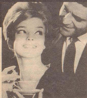
Ich verwende jetzt eben Pepsodent