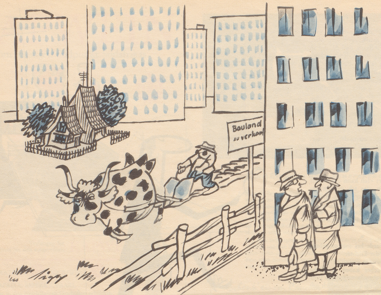
«Es scheint, als sei ihm unser letztes Angebot immer noch zu niedrig!»