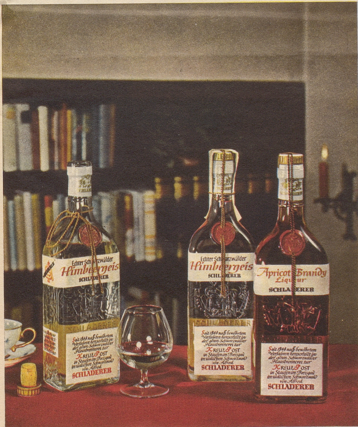
SCHLADERERS echter Schwarzwälder Himbeergeist und Apricot

Takt ist bei manchen Frauen geradezu Taktik. Th. M.