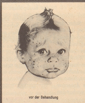
vor der Behandlung