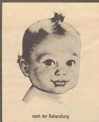
nach der Behandlung

Unzähligen Menschen auf der ganzen Welt, die an Ekzemen und anderen Hautkrankheiten gelitten haben, ist in den letzten Jahren durch eine Entdeckung schweizerischer Chemiker geholfen worden.