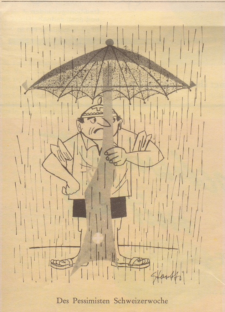
Des Pessimisten Schweizerwoche