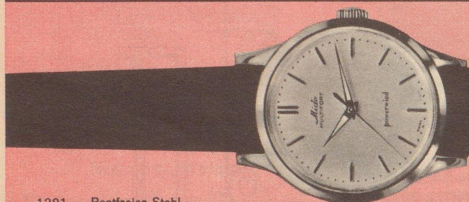
1201 Rostfreier Stahl Zifferblatt mit Reliefzahlen und Leuchtzeichen Fr. 180.—