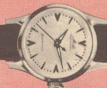
821 Rostfreier Stahl Zifferblatt mit hoch- geschliffenen Reliefzahlen und Leuchtzeichen Fr. 215.—