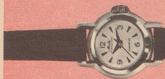
619 Rostfreier Stahl Zifferblatt mit Reliefzahlen Goldplaque Midoluxe Fr. 235.— Fr. 250.—