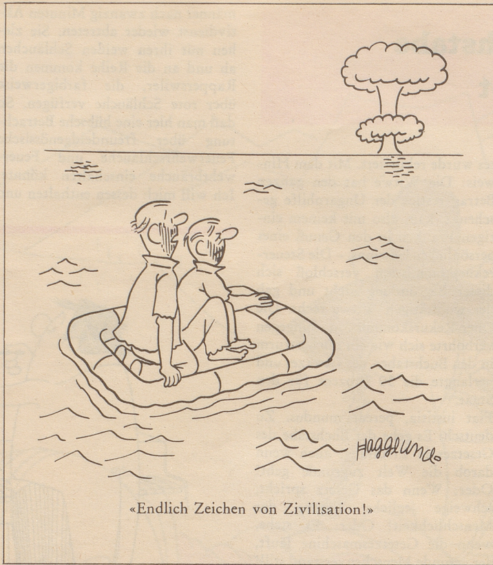
«Endlich Zeichen von Zivilisation!»