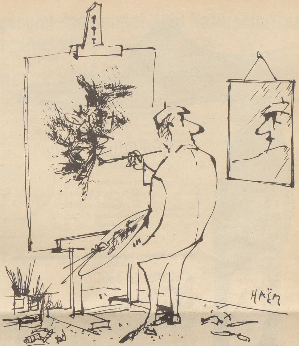
Erkenne dich selbst!