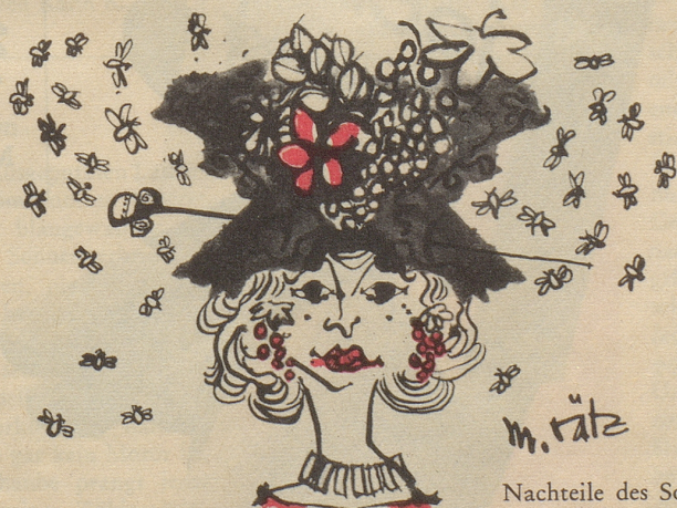
Nachteile des Sommerhütchens

Zuschriften für die Frauenseite sind an folgende Adresse zu senden: Bethli, Redaktion der Frauenseite, Nebelspalter, Rorschach. Nichtverwendbare Manuskripte werden nur zurückgesandt, wenn ihnen ein frankiertes Retourcouvert beigelegt ist.