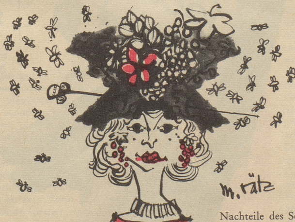
Nachteile des Sommerhütchens

Zuschriften für die Frauenseite sind an folgende Adresse zu senden: Bethli, Redaktion der Frauenseite, Nebelspalter, Rorschach. Nichtverwendbare Manuskripte werden nur zurückgesandt, wenn ihnen ein frankiertes Retourcouvert beigelegt ist.