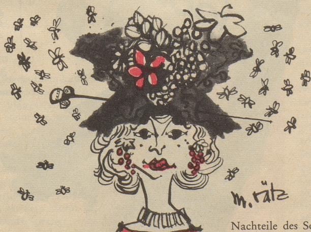
Nachteile des Sommerhütchens

Zuschriften für die Frauenseite sind an folgende Adresse zu senden: Bethli, Redaktion der Frauenseite, Nebelspalter, Rorschach. Nichtverwendbare Manuskripte werden nur zurückgesandt, wenn ihnen ein frankiertes Retourcouvert beigelegt ist.