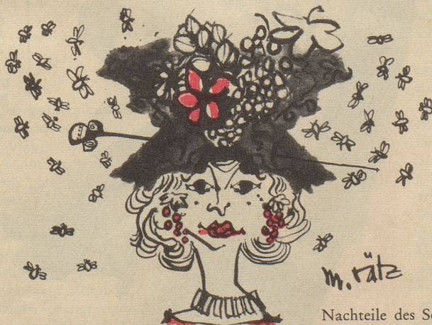
Nachteile des Sommerhütchens

Zuschriften für die Frauenseite sind an folgende Adresse zu senden: Bethli, Redaktion der Frauenseite, Nebelspalter, Rorschach. Nichtverwendbare Manuskripte werden nur zurückgesandt, wenn ihnen ein frankiertes Retourcouvert beigelegt ist.