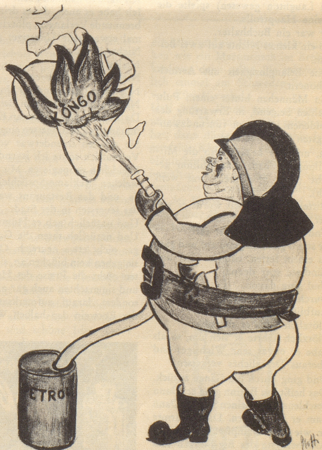
Stets zur Stelle