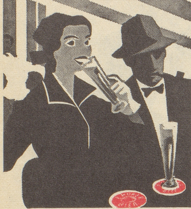
Das Boulevard-Restaurant in Chur