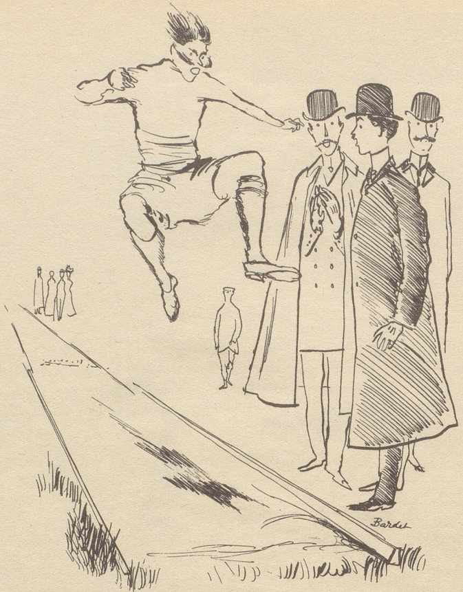
Olympisches um 1900