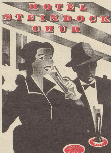
Das Boulevard-Restaurant in Chur