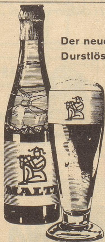
Der neue Durstlöcher

MALTI ist das erste und einzige im Dual-Verfahren aus Hopfen und Malz gebaute Bier – alkoholfrei und doch rassig.