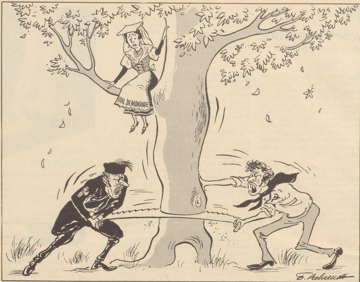
Mit vereinten Kräften...