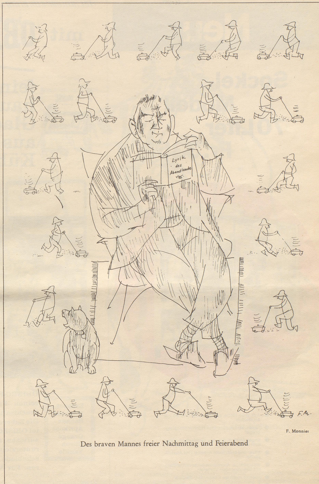
Des braven Mannes freier Nachmittag und Feierabend

Als er in die Wachstafel kritzelte, flog ein Adler über die Bucht von Syrakus. In seinen Fängen hielt er