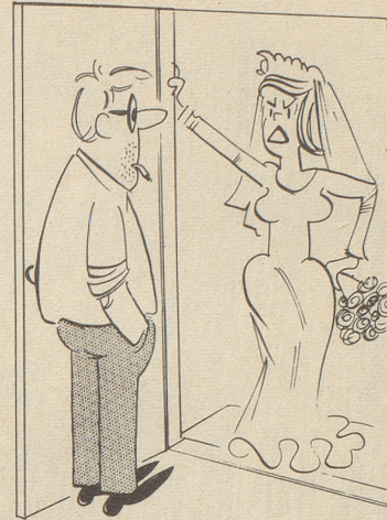
«Doch doch, auf den heutigen Tag haben wir uns angemeldet!»