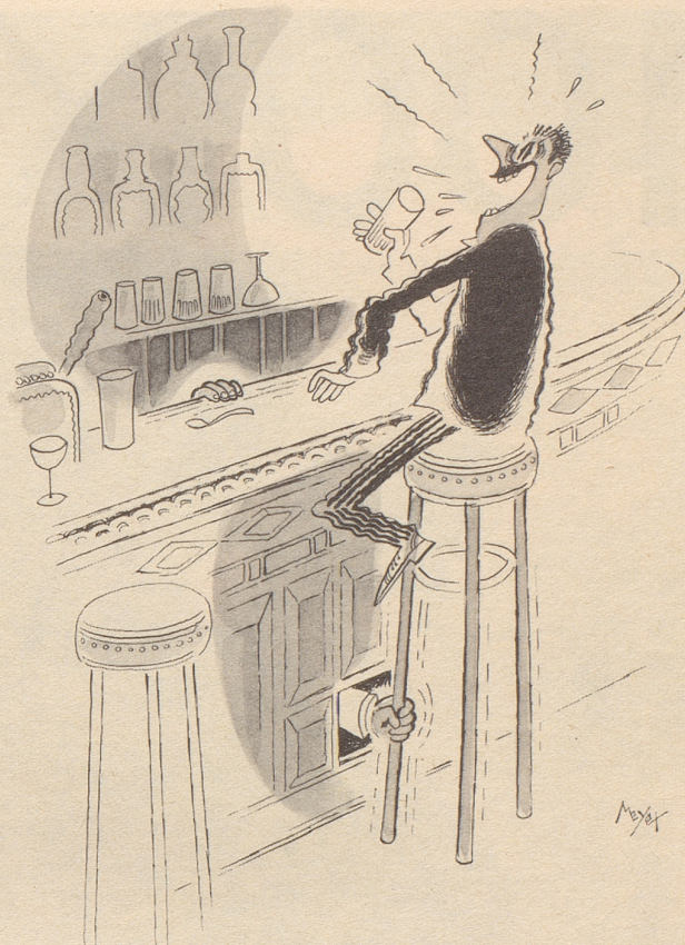
Der letzte zähe Gast

erhob sich der Löwenherz. Zeit, Komplize, befahl er.