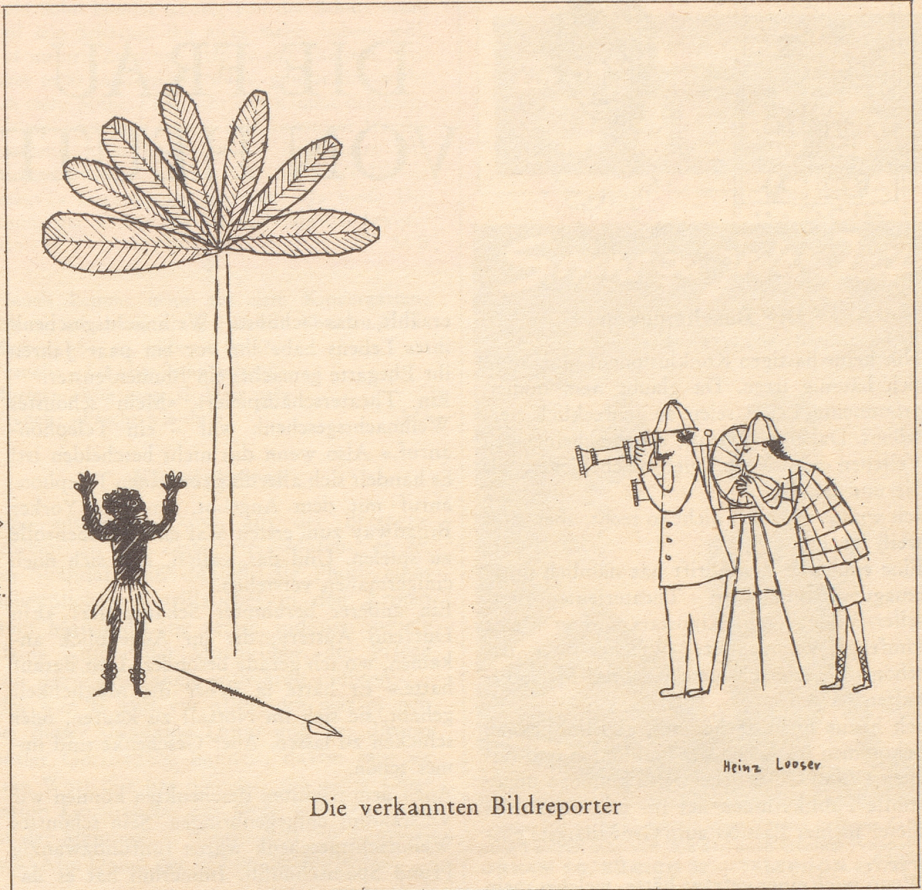
Die verkannten Bildreporter