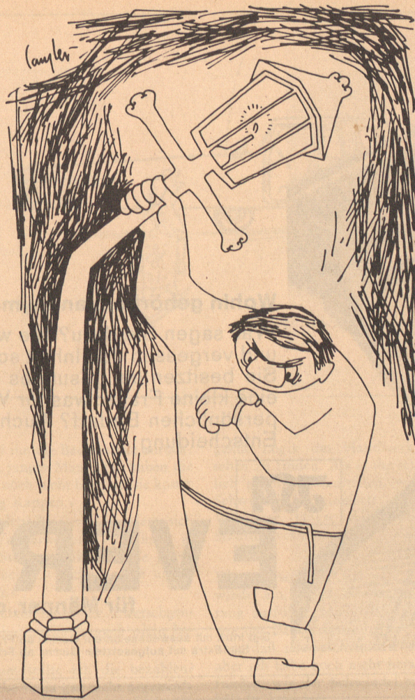
Schon so spät!

Auf einem weit ausbauchenden Giltsteinofen steht das Wappen der Gemeinde mit der Jahrzahl des Entstehens ihrer Stube. Ob sie auch das Geburtsjahr jener Anekdote ist? Wer weiß es? Jahrhunderte sind seitdem verflossen. Aber auch die Heutigen sitzen noch auf klobigen Bänken an langen Tischen und lassen sich von den Ratsherren Wein einschenken aus Zinnkannen, wie deren ringsum an den Wänden mehr prangen. Je origineller die Gemeinde ist, umso mehr Zinnkannen besitzt sie. Im abgeschlossenen Eifischtal gibt es solche, in deren Stube und Keller an hundert und mehr Zinnkannen gezählt werden können,