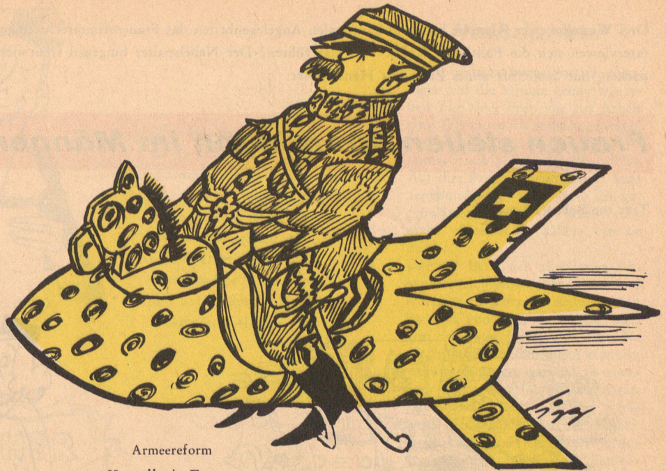
Armee reform Kavallerie-Ersatz

Ein Raketenbummler mit Begleiterin hält vor dem Polizisten auf der Weltraumverkehrinsel: «Wie weit ist es noch zur Milchstraße?» – «Nicht mehr weit. Immer geradeaus bis zum Mars, dann links bis zum Saturn, und in 154 Lichtjahren sind Sie dort.» bi