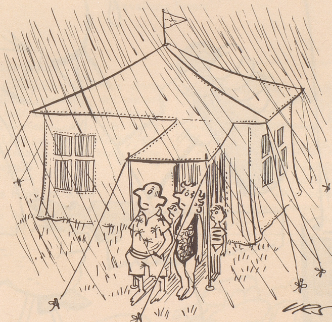
in den Ferien