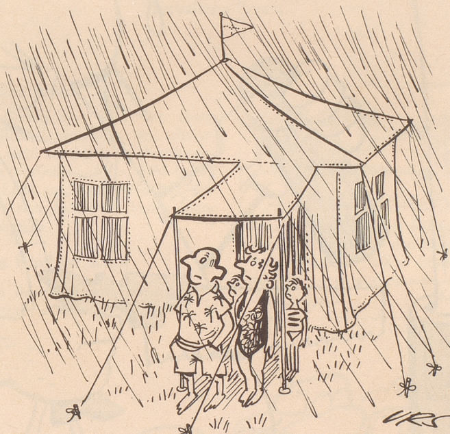
in den Ferien