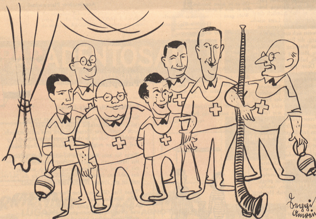
Die erste Gesamtaufnahme 1960