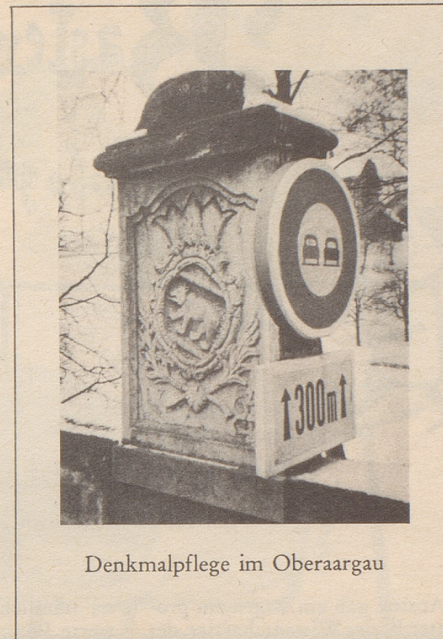
Denkmalpflege im Obergeraargau

sendet (mit dem Vermerk auf der Rückseite des Postabschnittes: Für die Osteuropa-Bibliothek), bekundet seinen wachen Sinn für die Notwendigkeit der Abwehr der kommunistischen Gefahr.