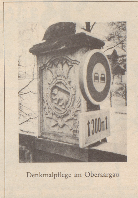
Denkmalpflege im Obergeraargau

sendet (mit dem Vermerk auf der Rückseite des Postabschnittes: Für die Osteuropa-Bibliothek), bekundet seinen wachen Sinn für die Notwendigkeit der Abwehr der kommunistischen Gefahr.