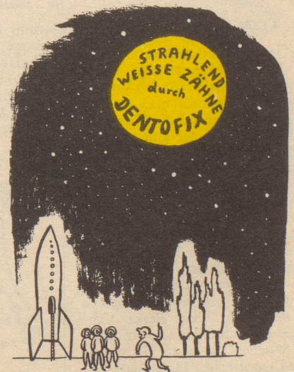
was jetzt im Sektor Mond zu befürchten ist - - -

Glauber ers, as d Gescht im «Bären» ammen e göttligi Freud hei, wenn das Gschichtli vom Schwingerkönig uf s Tapeet chunnt. KL