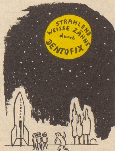
was jetzt im Sektor Mond zu befürchten ist ---

Glauber ers, as d Gescht im «Bären» ammen e göttligi Freud hei, wenn das Gschichtli vom Schwingerkönig uf s Tapeet chunnt. KL