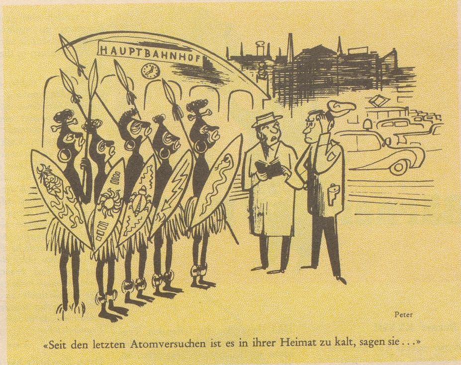
«Seit den letzten Atomversuchen ist es in ihrer Heimat zu kalt, sagen sie ...»