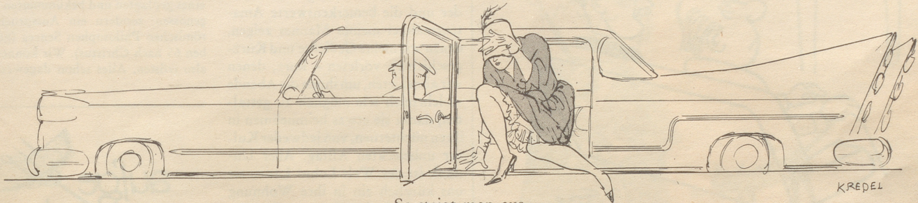
So steigt man aus