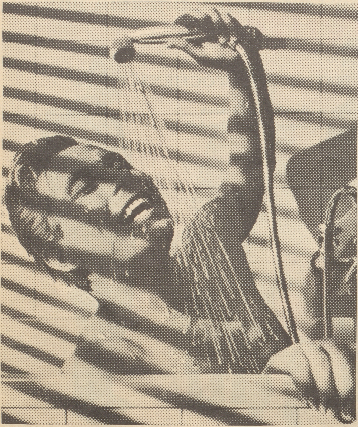
Die Gäste wollen Sie fröhlich sehen: