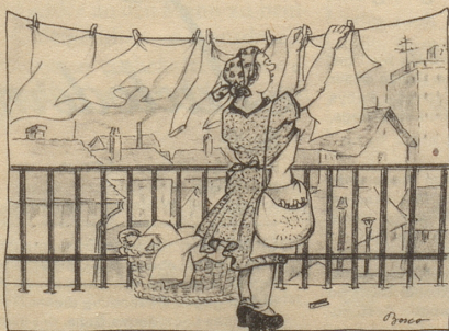
Die praktische Randlinie