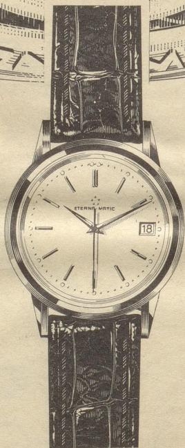
071BT-1422 «Dato» automatisch, wasserdicht versenkte Krone Edelstahl ab Fr. 230.- Goldfront ab Fr. 280.- Goldmantel ab Fr. 330.- 18 Kt. Gold ab Fr. 675.-