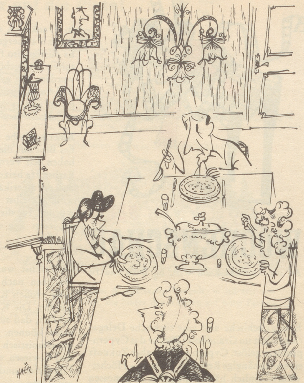
«iß di Suppe, i will kei Halbschtarchi in dr Familie!»